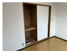
同マンション同タイプです