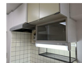
同マンション同タイプです

※この図面はATBBの物件情報の一部を抜粋して掲載しております。(現況優先) ※入居日・引渡日変更や付帯条件、別途料金が発生する場合がありますのでご確認ください。