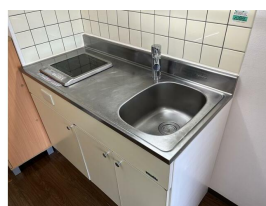
同マンション同タイプです