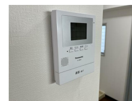
同マンション同タイプです