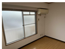
同マンション同タイプです