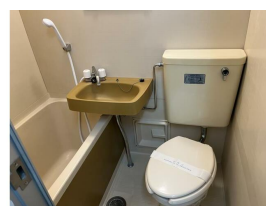
同マンション同タイプです